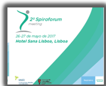
► PORIB Spiroforum Meeting