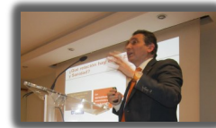
► PORIB Formación