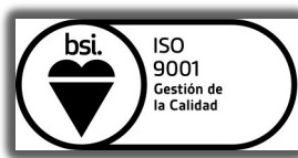
► PORIB ISO 9001:2015